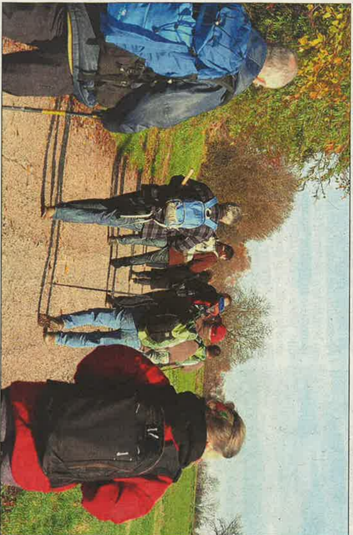
Samedi matin, le soleil était au rendez-vous, entre Wattwiller et Thierenbach.